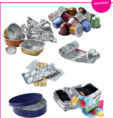
Les petits emballages en métal (capsules, couvercles, tubes, plaquettes de médicaments, boîtes sachets...)