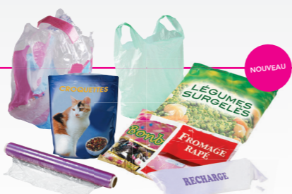
Les sacs, sachets et films