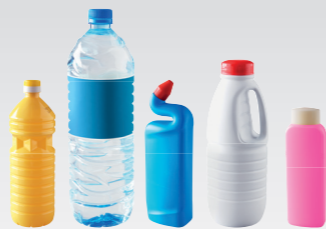
Les bouteilles et flacons