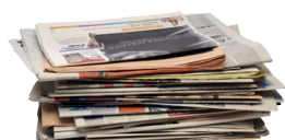
Les journaux et magazines