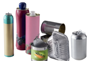
Les aérosols, bidons, boîtes de conserve, barquettes et canettes en métal