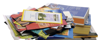
Les publicités et prospectus