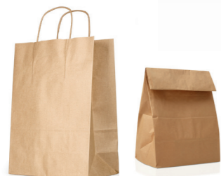
Les sacs, sachets