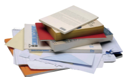
Les enveloppes et les papiers