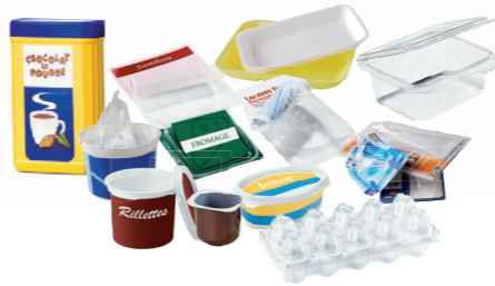
Les pots, boîtes et barquettes