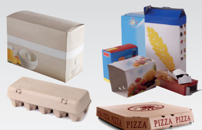
Les boîtes et cartons